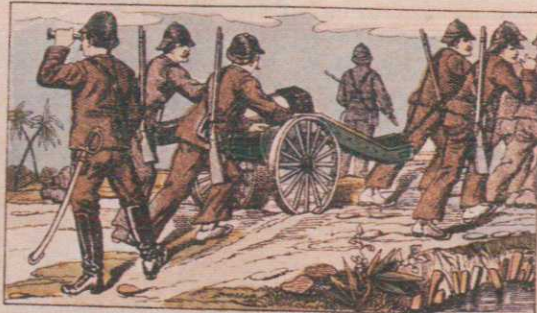
Pièce de montagne, embourbée sur une digue et trainée à la bricole par les soldats de marine.