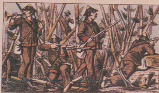
Annamites au service de la France et organisés spécialement en corps d'éclaireurs. En tirailleurs dans les bambous.