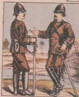
TENUE D'ÉTÉ DES TROUPES Officiers