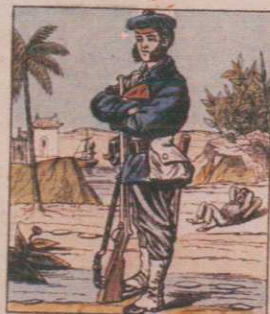
FUSILIER MARIN Tenue de Campagne