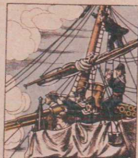
Canons-revolvers placés dans la hune d'une canonnière et soutenant l'attaque.