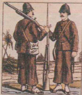
TENUE D'ÉTÉ DES TROUPES Soldats