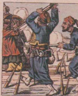
CHARGE A LA BAIONNETTE Les Turcos à l'attaque des postes avancés aux abords de Son-Tay.