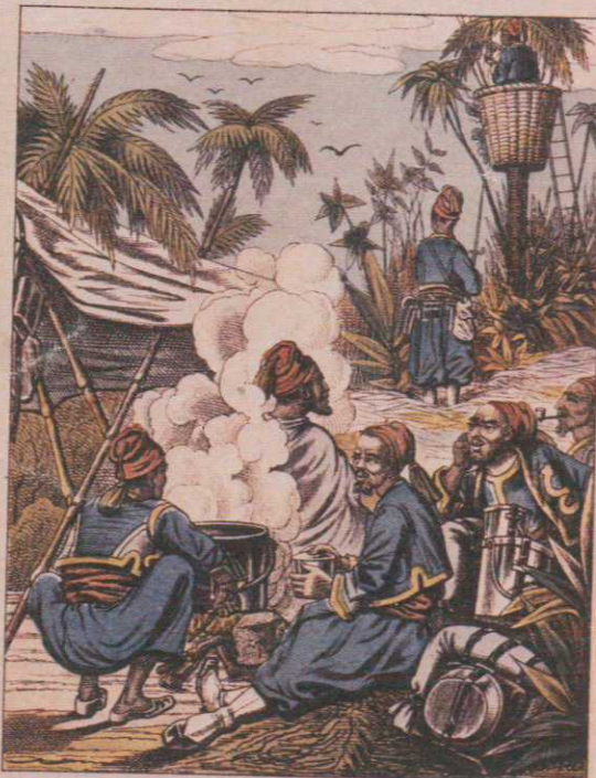
Bivouac de Turcos gardé par une sentinelle dissi- mulée dans le feuillage d'un palmier.