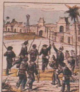
Attaque par les marins de la flottille du Fleuve-Rouge d'un village fortifié aux abords de Son-Tay.